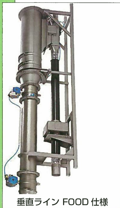
垂直ライン FOOD 仕様