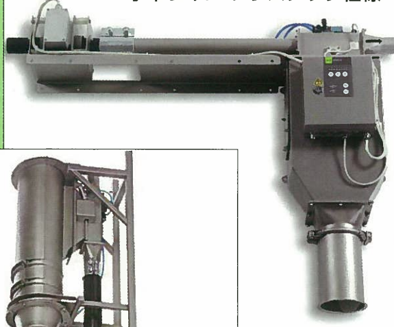
水平ライン プラスチック仕様

空気搬送されるバルク材料中から磁性金属・非磁性金属を検知し、 空気の流れを遮断することなく自動的に排出します。